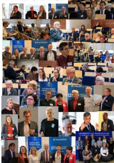
XXIII KDE Łódź, 2017